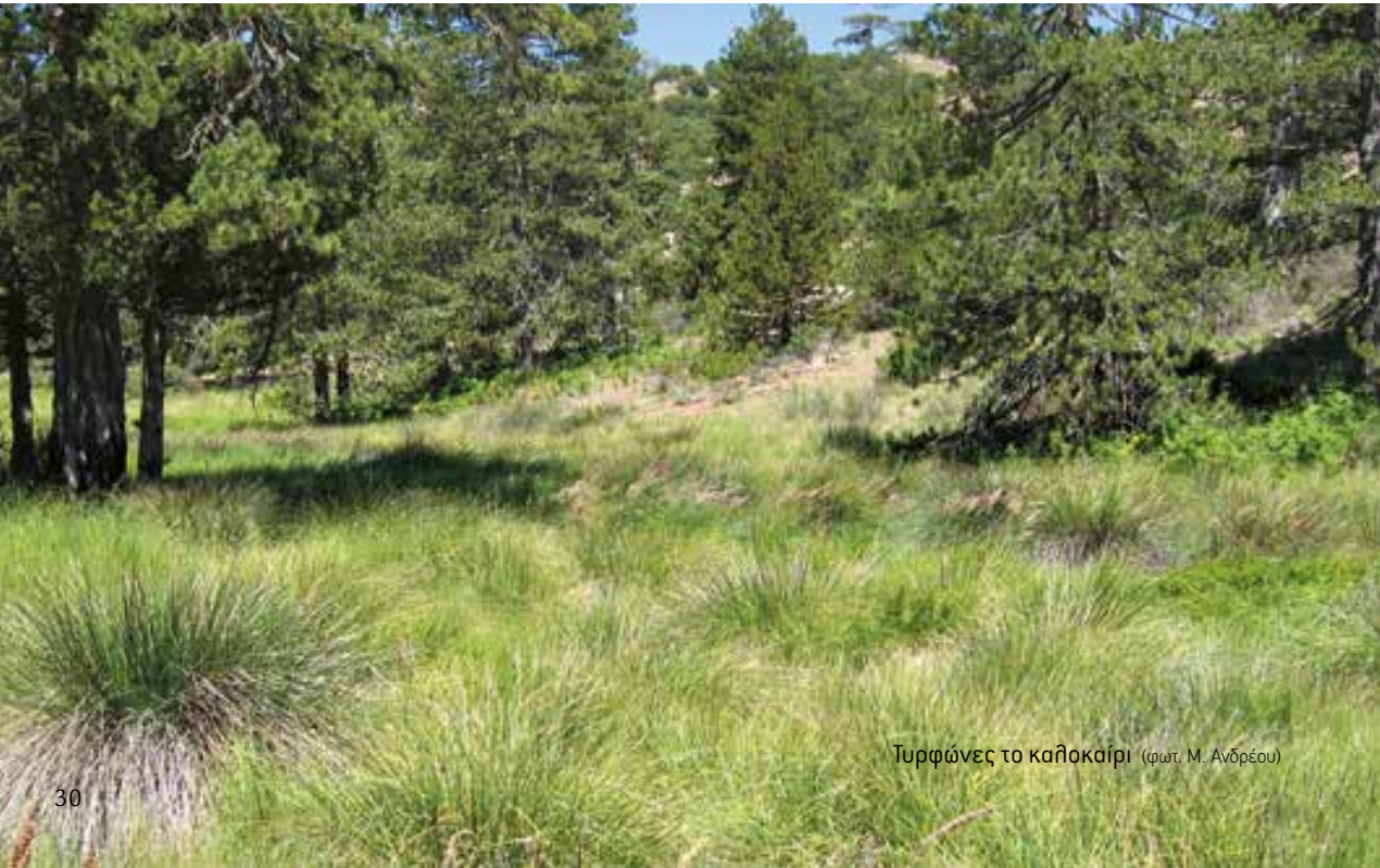
Τυρφώνες το καλοκαίρι