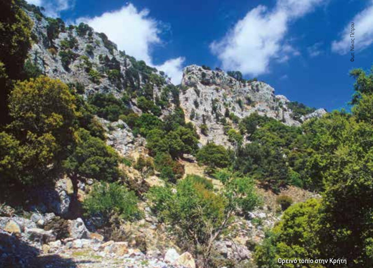
Ορεινό τοπίο στην Κρήτη

οχών σύμφωνα με τις οικείες διατάξεις της εθνικής νομοθεσίας.