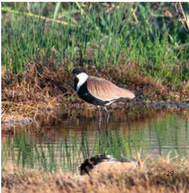
Αγκαθοκαλημάνη ή πελοκατερίνα ( Vanellus spinosus )