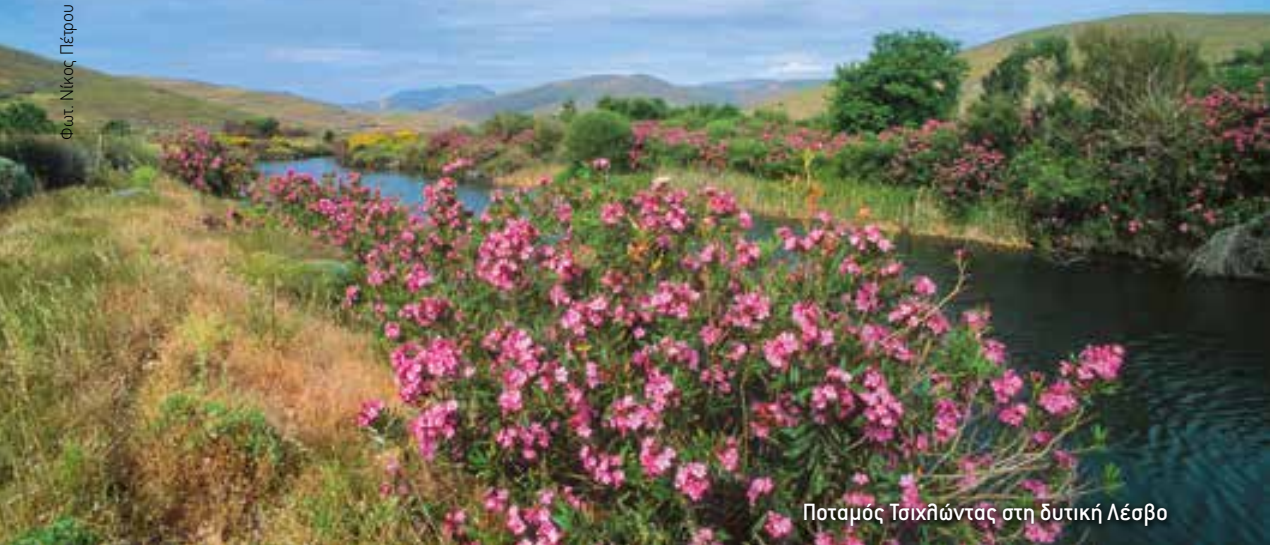
Ποταμός Τσιχλιώντας στη δυτική Λέσβο