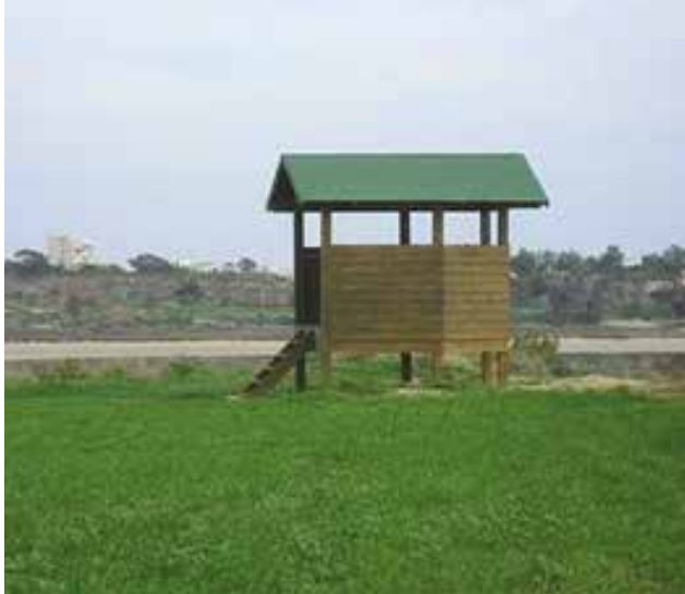
Παρατηρητήριο πουλιών στις Αλυκές Λάρνακας

θεμάτων φυτών σε τέσσερις περιοχές της Κύπρου (περιοχή Μιτσερού, περιοχή Κοιλάδα των Κέδρων-Κάμπος, Χερσόνησος του Ακάμα, Περιοχή Ασγάτας).