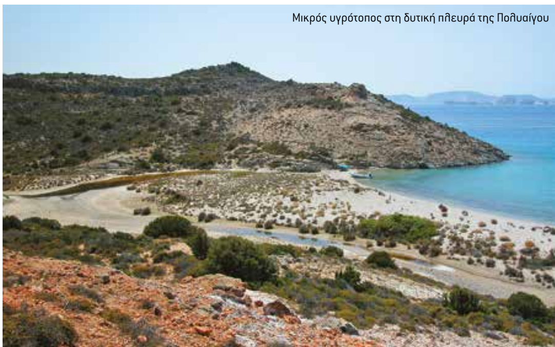
Μικρός υγρότοπος στη δυτική πλευρά της Ποθουαίγου

επαρκεί αφού το ζητούμενο δεν είναι απλώς η ύπαρξή του αλλά και η εφαρμογή. Καθώς οι λεγόμενοι αρμόδιοι φορείς είναι για πολλούς και γνωστούς λόγους ανεπαρκείς, η επίτευξη των στόχων του Π. Δ/τος θα εξαρτηθεί σε μεγάλο βαθμό από τις δράσεις των ενεργών πολιτών και των περιβαλλοντικών οργανώσεων. Το θεσμικό αυτό εργαλείο για την προστασία των πολύτιμων και πλέον απειλούμενων οικοσυστημάτων των νησιών μας, μπορεί να γίνει αποτελεσματικό, καθώς στο πλαίσιο του νόμου για τη βιοποικιλότητα δίνεται η δυνατότητα να παρίστανται ως πολιτικός ενάγοντες εκτός των άλλων και «μη κυβερνητικές οργανώσεις και φυσικά πρόσωπα, ανεξάρτητα αν έχουν υποστεί περιουσιακή ζημιά, με αίτημα την αποκατάσταση των πραγμάτων, στο μέτρο που αυτή είναι δυνατή» και μάλιστα χωρίς να απαιτείται έγγραφη διαδικασία. ■