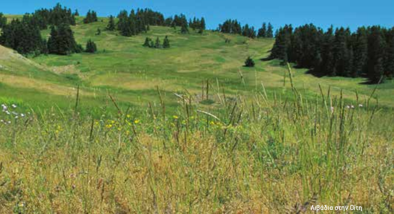
Λιβάδια στην Οίτη

κρίνεται πως, παρ' ό τι η περιβαλλοντική εκτίμηση που έχει γίνει για την κατασκευή και λειτουργία του είναι αρνητική και ελλείψει εναλλακτικών λύσεων, πρέπει να πραγματοποιηθεί για άλλους επιτακτικούς λόγους σημαντικού δημοσίου συμφέροντος, περιλαμβανομένων λόγων κοινωνικής ή οικονομικής φύσεως. Επισημαίνεται δε, στο κείμενο της Οδηγίας (αρθ. 6 παρ. 4) ότι, όταν στον τόπο περί του οποίου πρόκειται βρίσκονται ένας τύπος φυσικού οικοτόπου προτεραιότητας ή/και ένα είδος προτεραιότητας, είναι δυνατόν να προβληθούν μόνον επιχειρήματα σχετικά με την υγεία ανθρώπων και τη δημόσια ασφάλεια κ.λπ.