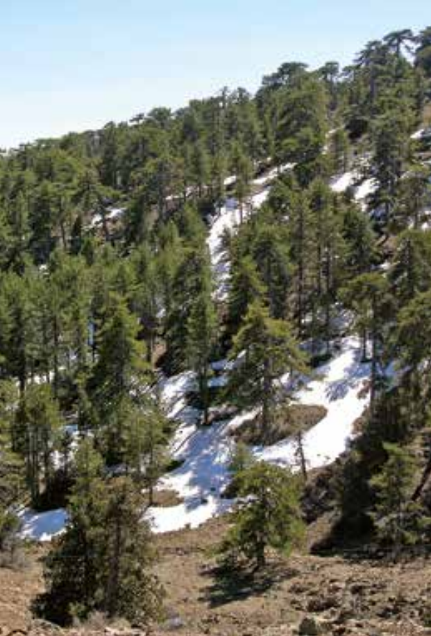
Δάσος Pinus nigra

3. JUNIPERCY «Βελτίωση της κατάστασης διατήρησης του οικοτόπου προτεραιότητας 9560* (ενδημικά δάση με Juniperus spp. ) στην Κύπρο» (LIFE10 NAT/CY/000717, 2012-2015) που αφορά αποκλειστικά το ενδιαίτημα των Juniperus στην Κύπρο.