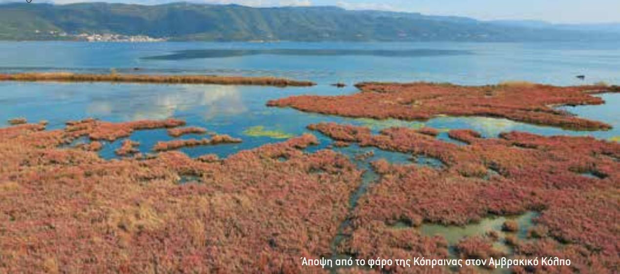
Άποψη από το φάρο της Κόπραινας στον Αμβρακικό Κόλπο

αυτή δεν αντίκειται στο άρθρο 24 του Συντάγματος, αφού, πάντως, για την έγκριση περιβαλλοντικών όρων πρέπει να εξετάζονται οι επιπτώσεις του έργου και να συνεκτιμάται η μηδενική λύση και, συνεπώς, παρέχεται η δυνατότητα άρνησης της περιβαλλοντικής αδειοδότησης αν διαπιστωθεί ότι η περιβαλλοντική βλάβη από τη μεταλλευτική ή λατομική δραστηριότητα στη συγκεκριμένη περιοχή, ύστερα από στάθμιση και του οφέλους από τη δραστηριότητα αυτή, υπερβαίνει τα επιτρεπτά κατά το νόμο και την αρχή της βιώσιμης ανάπτυξης όρια.