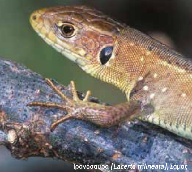
Τρανόσαυρα ( Lacerta trilineata ), Σάμος