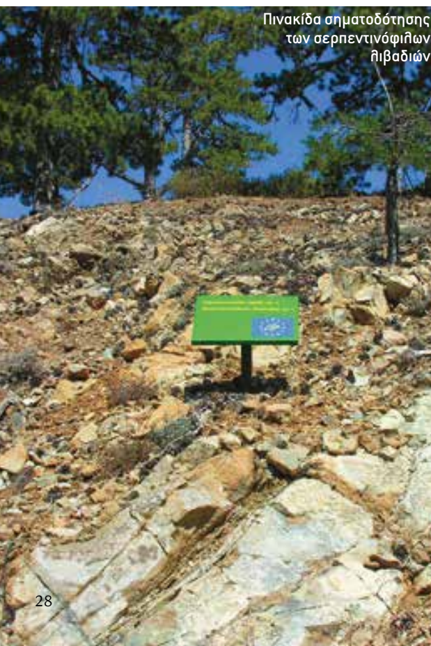
Πινακίδα σηματοδότησης των σερπεντινόφιλων θιβαδιών