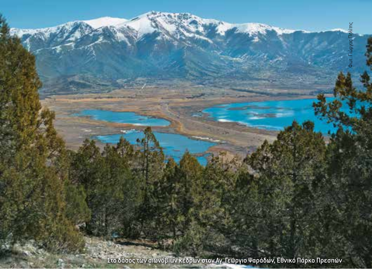
Στο δάσος των αιωνόβιων κέδρων στον Αγ. Γεώργιο Ψαράδων, Εθνικό Πάρκο Πρεσπών

ασάφεια και η έλλειψη κεντρικών κατευθύνσεων και προτεραιοτήτων στην εθνική πολιτική για την προστασία και διαχείριση του φυσικού περιβάλλοντος, καθώς και το έλλειμμα ενημέρωσης των τοπικών πληθυσμών ως προς το πραγματικό περιεχόμενο του πλαισίου προστασίας και διαχείρισης, αλλά και ως προς τις αναπτυξιακές δυνατότητες και ευκαιρίες, οι οποίες πηγάζουν από την ένταξη μίας περιοχής σε ένα καθεστώς προστασίας.