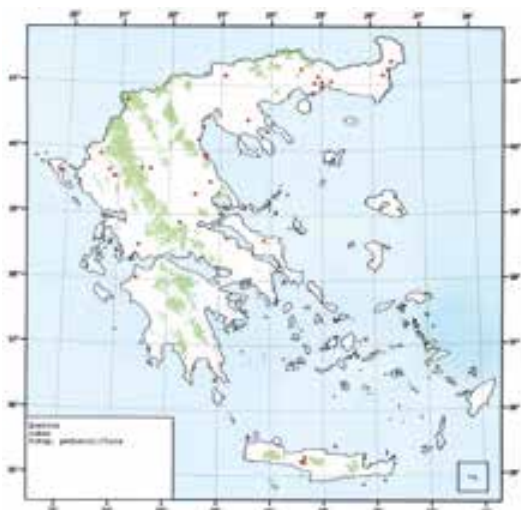
Η εξάπλωση της Quercus robur subsp. pedunculiflora και οι νέες θέσεις στην Κρήτη