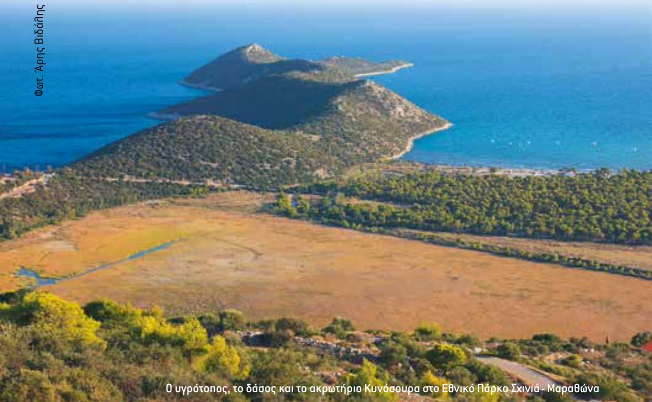
Ο υγρότοπος, το δάσος και το ακρωτήριο Κυνόσουρα στο Εθνικό Πάρκο Σινιά - Μαραθώνα

τα να διεκδικηθούν πολύ περισσότεροι πόροι για την προστασία της βιοποικιλότητας. Γι' αυτό χρειάζεται να υπάρχει ένα λειτουργικό σύστημα προστατευόμενων περιοχών, το οποίο παρακολουθείται, το οποίο διαχειρίζονται άνθρωποι με γνώση, και για το οποίο διατίθενται επαρκείς πόροι. Αυτό σήμερα δεν υπάρχει. Με το ξεκίνημα της διαδικασίας των Πλαισίων Δράσης Προτεραιότητας, δίνεται μία μεγάλη ευκαιρία αυτή τη στιγμή στην Ελλάδα να βάλει τα πράγματα κάτω, να δει τί είναι αυτό που χρειάζεται μέσα στα επόμενα χρόνια, να το κοστολογήσει σωστά και να το διεκδικήσει.