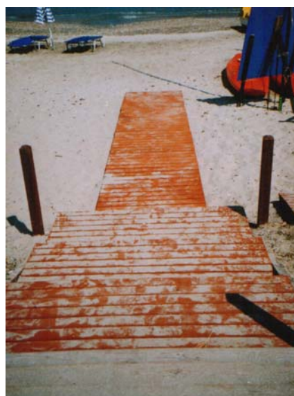
Πρόσβαση για ΑΜΕΑ