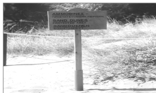
Περίφραξη και σήμανση αμμοθινών

Οι ακτές όπου οι θαλάσσιες χελώνες Carretta – carretta γεννούν τα αυγά τους ανήκουν στις προστατευόμενες περιοχές του δικτύου Natura 2000 και οι διαχειριστές με βραβευμένες ακτές καταβάλουν υποχρεωτικά προσπάθειες για την προστασία τους. Ένα μικρό παράδειγμα είναι αυτό: