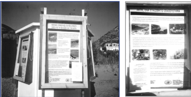
Πληροφορίες για το φυσικό περιβάλλον

Διαχειριστές που έχουν κοντά τους ή στην ευρύτερη περιοχή βίοτοπους – λιμνοθαλάσσια οικοσυστήματα – δάση – παραποτάμια εκτάσεις τοποθέτησαν καλαισθητες πινακίδες με τη σχετική πληροφόρηση.