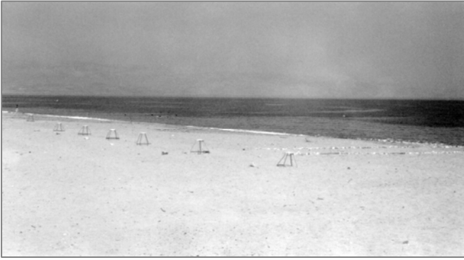
Σήμανση και προστασία φωλεών της Carretta-carretta

Διαχειριστές που έχουν κοντά τους ή στην ευρύτερη περιοχή βίοτοπους – λιμνοθαλάσσια οικοσυστήματα – δάση – παραποτάμια εκτάσεις τοποθέτησαν καλαισθητες πινακίδες με τη σχετική πληροφόρηση.