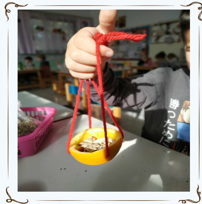
Και να το αποτέλεσμα!!!