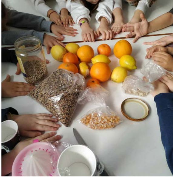
Συγκεντρώσαμε τα φρούτα...