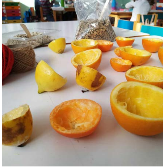
Στύψαμε το χυμό τους...