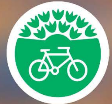
Μετακινήσεις και Μεταφορές