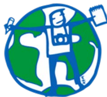
Νέοι Δημοσιογράφοι για το περιβάλλον