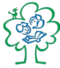
ΜΑΘΑΙΝΩ ΓΙΑ ΤΑ ΔΑΣΗ